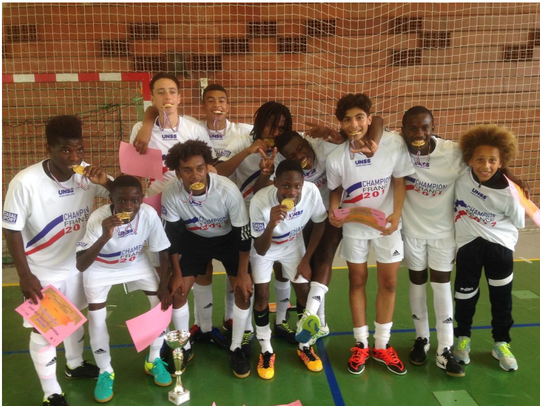
L'équipe du CS Brétigny football championne de France UNSS 2017

Durant la moitié de l'année, des entraînements en salle sont organisés les mercredis afin de faire travailler la technique individuelle des jeunes. Avec des résultats certains puisque nos élèves du collège Pablo Neruda ont été sacrés champions de France UNSS de futsal à deux reprises sur les trois dernières années !