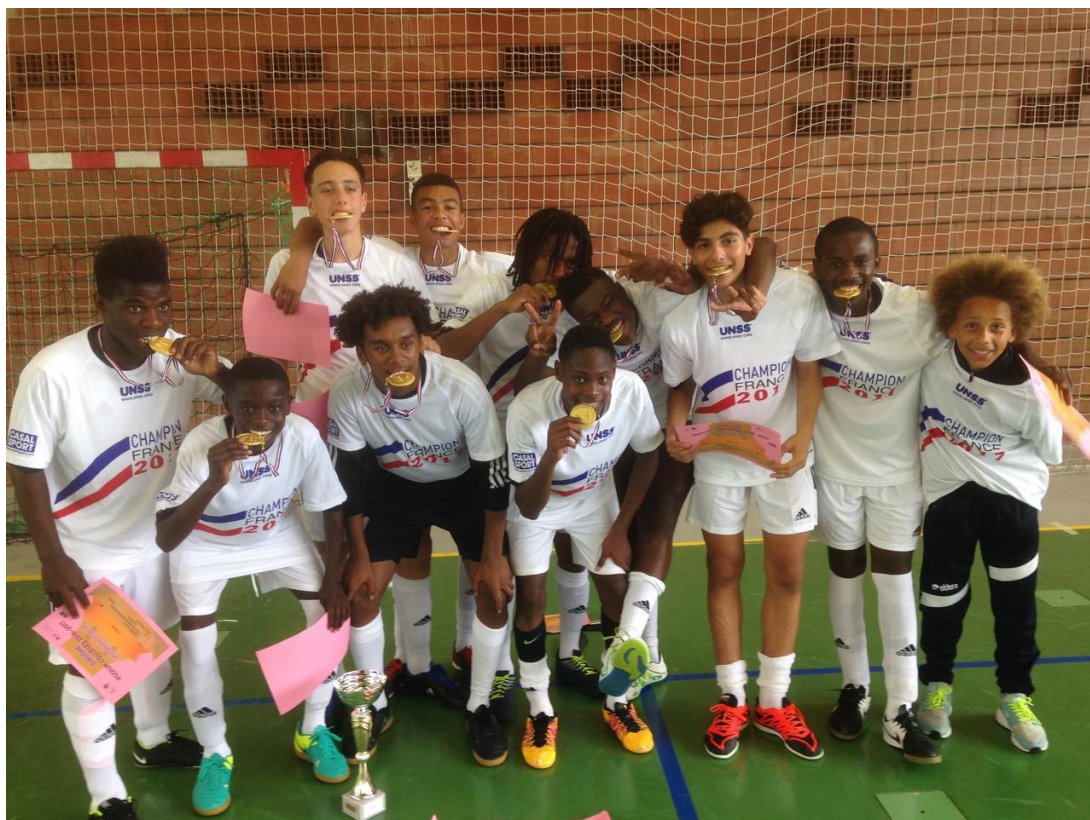
L'équipe du CS Brétigny football championne de France UNSS 2017

Durant la moitié de l'année, des entraînements en salle sont organisés les mercredis afin de faire travailler la technique individuelle des jeunes. Avec des résultats certains puisque nos élèves du collège Pablo Neruda ont été sacrés champions de France UNSS de futsal à deux reprises sur les trois dernières années !