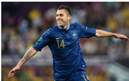
Jérémy Menez, International Français