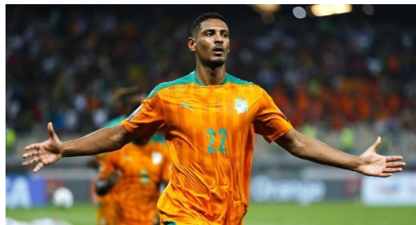
Sébastien Haller, International Ivoirien