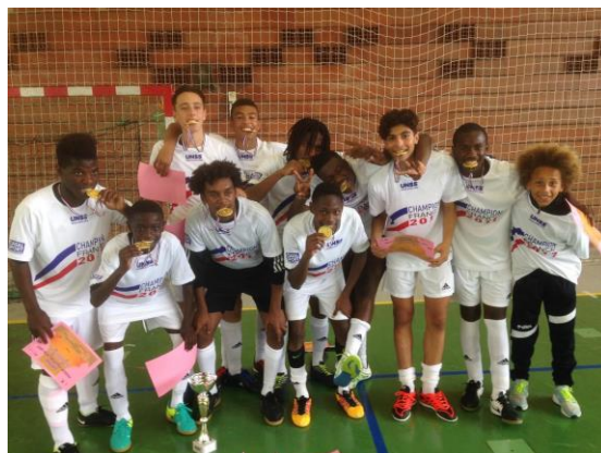
Champion de France futsal UNSS en 2017

Les élèves du collège Pablo Neruda atteignent régulièrement les championnats de France et ont été sacrés champions de France UNSS de futsal à deux reprises en 2015 et 2017 !