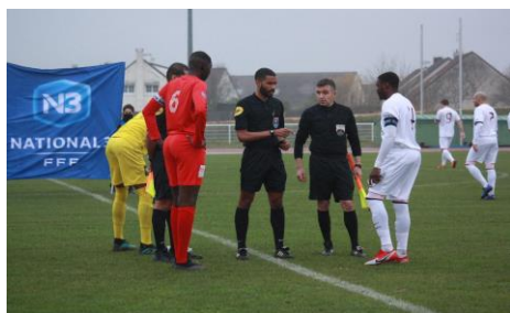
Match Séniors National 3, CSBF contre le PSG

Certains parviennent à s'épanouir au sein de la structure même du club en atteignant le niveau senior, notamment National 3.