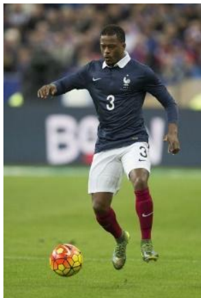
Patrice Evra, International Français