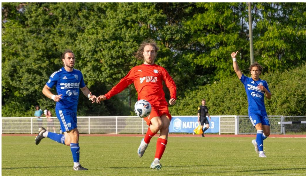
Des joueurs passés par nos Sections sportives scolaires évoluent régulièrement en National 3

Certains joueurs parviennent à s'épanouir au sein de la structure même du club en continuant leur progression pour atteindre le niveau senior, actuellement dans le relevé championnat National 3. Plusieurs joueurs formés au club et dans nos Sections font partie, en effet, du groupe de l'équipe première du club. Dans des proportions uniques à ce niveau pour un club amateur.