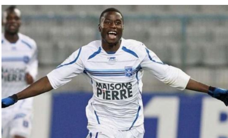
Paul-Georges Ntep, international français