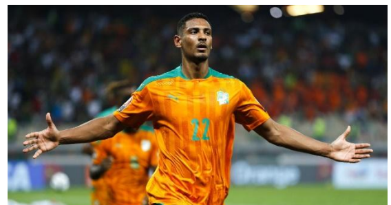
Sébastien Haller, international Ivoirien