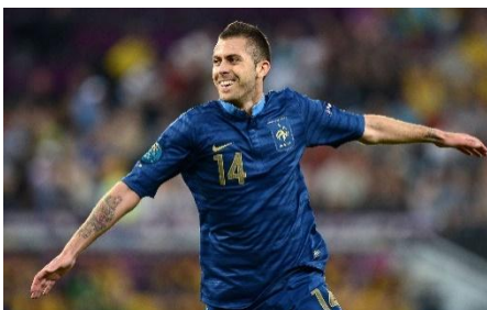
Jérémy Ménéz, International Français